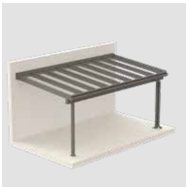
LIVINGBOX COMPACT Terrassendach mit Wand- bzw. Fassadenanschluss und Stehern vorne.