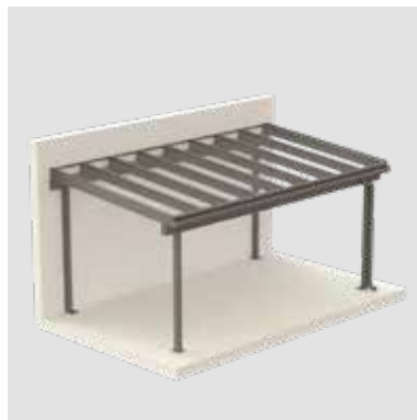
LIVINGBOX SOLID Terrassendach mit Stehern vorne und hinten bzw. fassadenseitig und Anbindung zur Hausfassade.